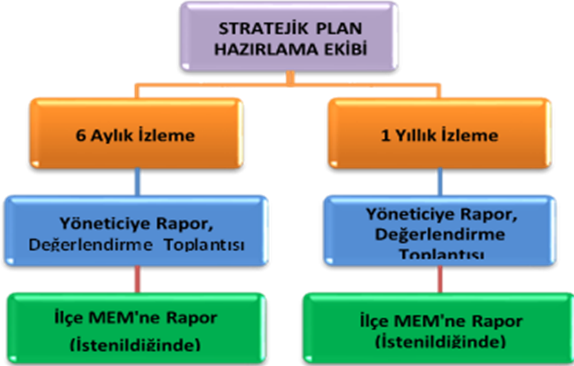
Şekil 3: İzleme ve Değerlendirme Süreci

Müdürlüğümüzün 2019-2023 Stratejik Planı İzleme ve Değerlendirme sürecini ifade eden İzleme ve Değerlendirme Modeli hazırlanmıştır. Müdürlüğümüzün Stratejik Plan İzleme- Değerlendirme çalışmaları eğitim-öğretim yılı çalışma takvimi de dikkate alınarak 6 aylık ve 1 yıllık sürelerde gerçekleştirilecektir. 6 aylık sürelerde rapor hazırlanacak ve değerlendirme toplantısı düzenlenecektir. İzleme-değerlendirme raporu, istenildiğinde İlçe Milli Eğitim Müdürlüğü'ne gönderilecektir. Ayrıca ilçemizin Mülki İdari Amirine sunulacaktır. 1 yıllık izleme-değerlendirme çalışmaları, Stratejik Planımızda yer alan hedeflerin yıllık düzeyde ifade edildiği Performans Programı ve yılsonunda gerçekleşme düzeylerinin belirlendiği Faaliyet Raporu hazırlanarak yapılacaktır.